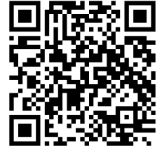
Guía rápida M256 (M250 + M56)